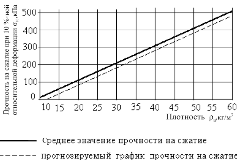
Рисунок В.1 – Зависимость прочности на сжатие при 10 %-ной относительной деформации от плотности (косвенный метод); 1 - a = 0,90 ; n = 495

Регрессия для \rho_a \geq 11 \text{ кг/м}^3 ;